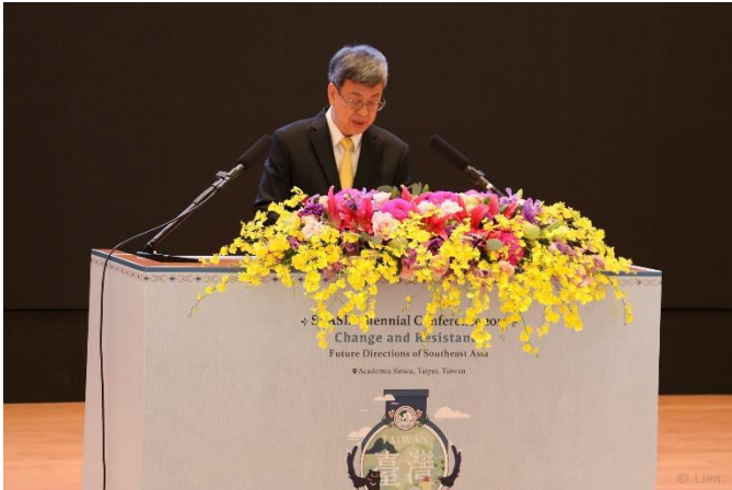
圖一：陳建仁副總統蒞臨開幕式