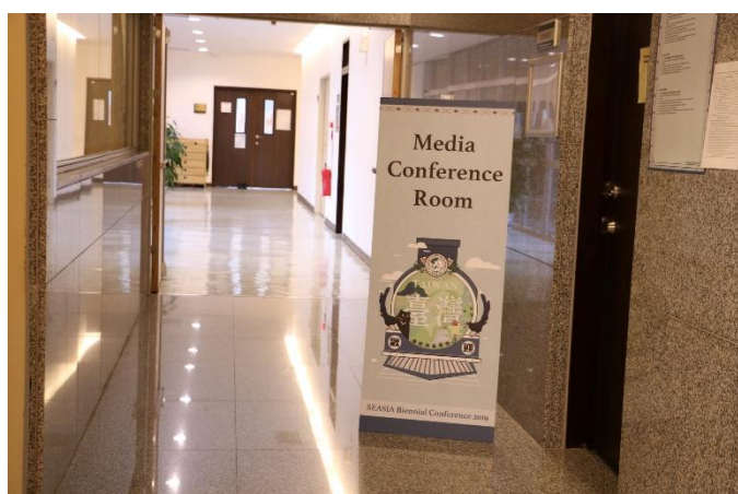
圖：會議場次場地布置