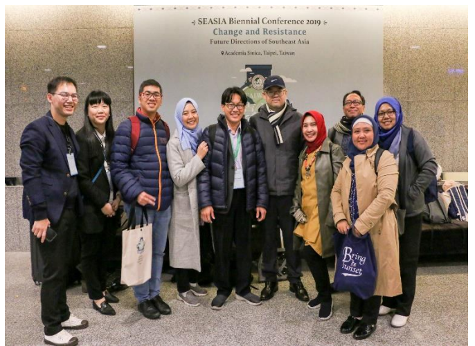
圖五：與會者與發表者之合影