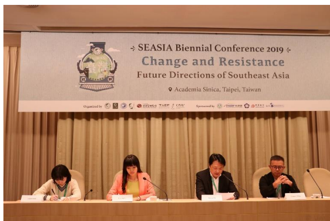
圖十五：圓桌論壇(二)的場次影像紀錄