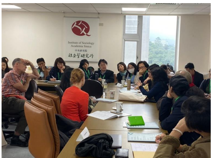
圖九：會議場次影像紀錄