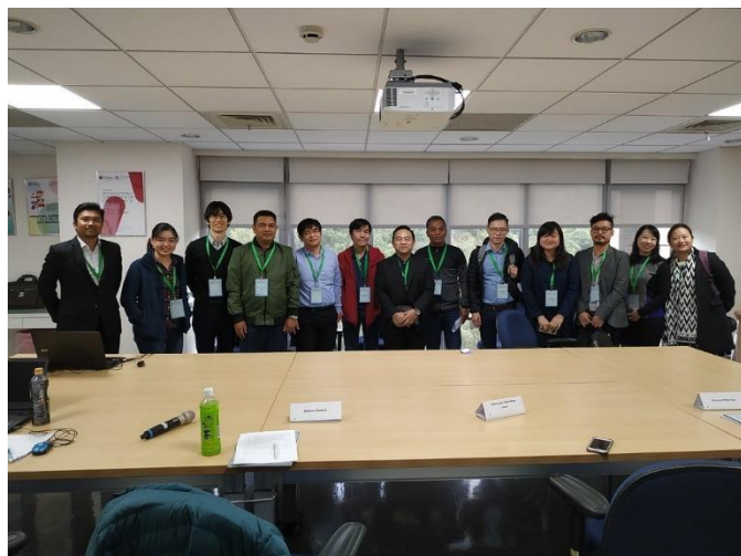
圖十六：與會者與發表者之合影