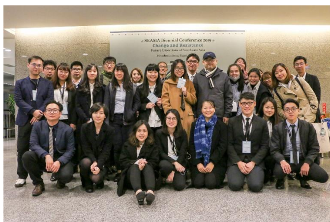
圖十八：全體工作人員合影