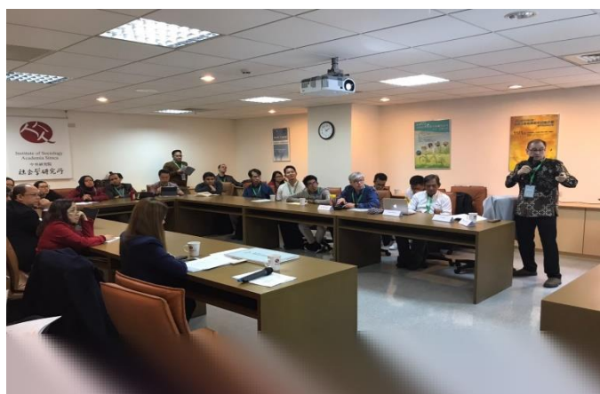
圖十一：會議場次影像紀錄