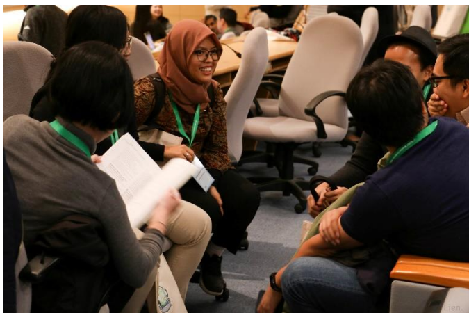
圖七：會議場次影像紀錄