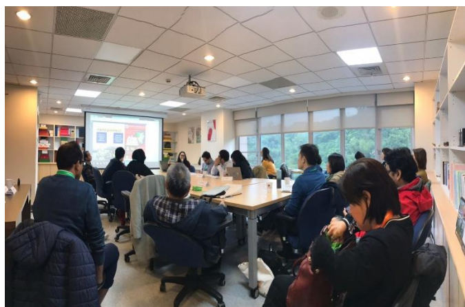
圖十：會議場次影像紀錄