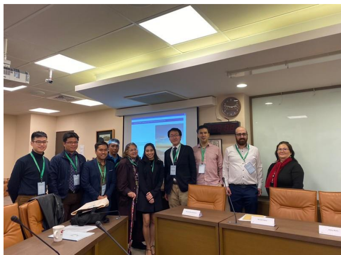
圖十二：與會者與發表者之合影