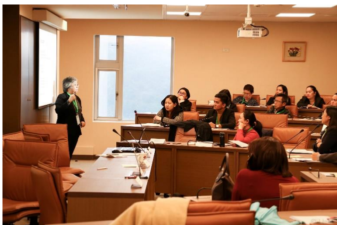
圖八：會議場次影像紀錄