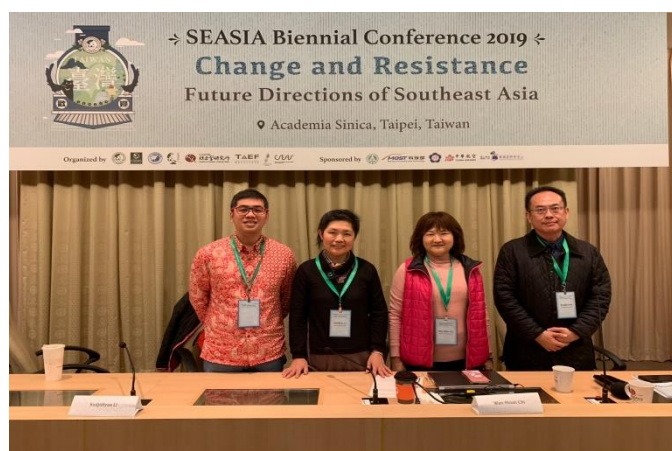
圖十七：圓桌論壇(九)的發表者合影