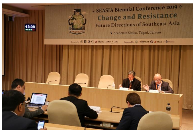
圖十四：圓桌論壇(七)的場次影像紀錄