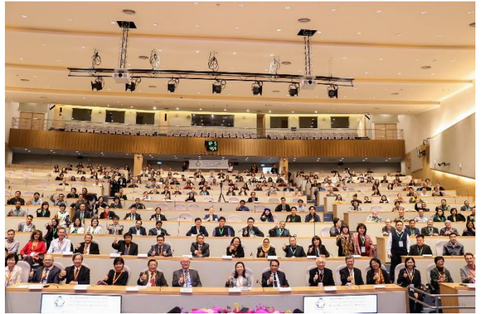
圖四：大會開幕式全體合影