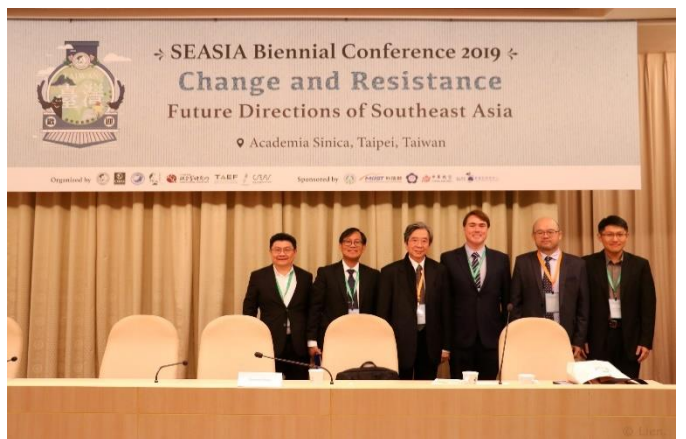
圖六：圓桌論壇(一)的發表者合影