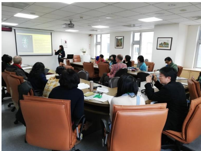
圖十三：會議場次影像紀錄