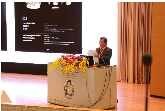
圖三：中研院臧振華院士的主題演講