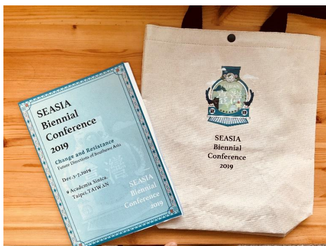
圖：會議手冊及提袋之實體圖